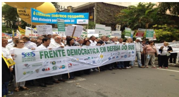
Frente Democrática em Defesa do SUS