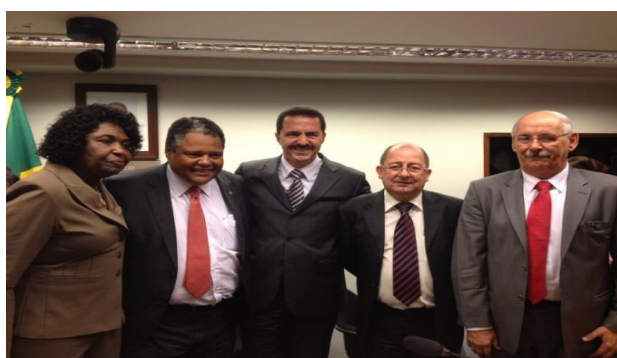
Posse da Frente Parlamentar Nacional das Santas Casas