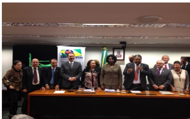
Posse da Frente Parlamentar Nacional das Santas Casas