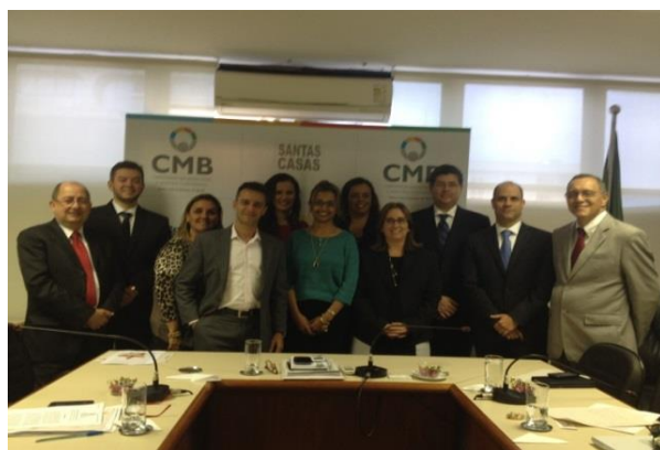
Conselho Jurídico da CMB